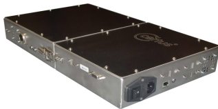
Le contrôleur mural

Système électromagnétique technologie Barkhausen jusqu'à 2 UP.