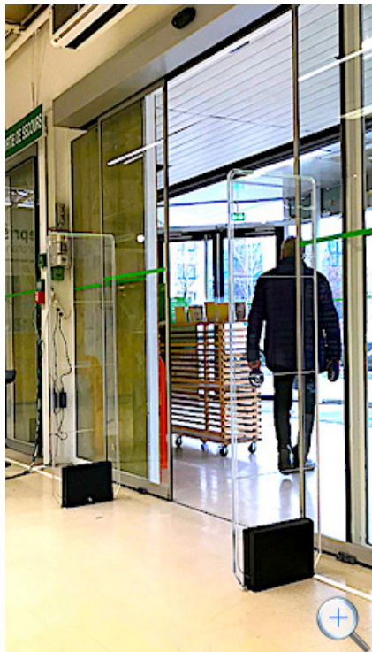
RF 47 en situation